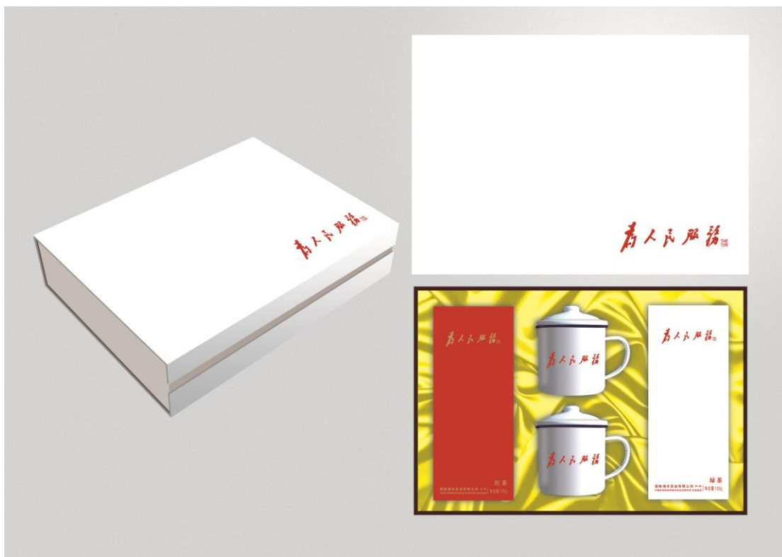
为人民服务——峥嵘岁月茶礼套装（效果图）