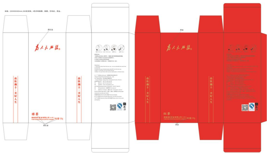
为人民服务——峥嵘岁月茶礼套装（盒型展开制作图二）